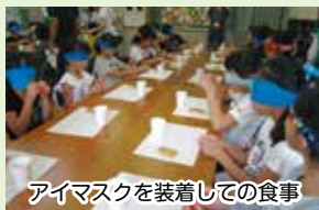
アイマスクを装着しての食事