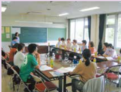
第2層協議体の会議状況

前号で紹介した、地域包括ケアシステム内の生活支援・介護予防部門への取り組みについて、自治会関係者、民生委員児童委員、地域包括支援センター、鎌ケ谷市、生活支援コーディネーター及び市社協で構成された、北部地区での「第2層協議体」となる会議が始まりました。第1回目(4月25日)の会議では、これから話し合う内容を確認し、会議名称を「たすけあい活動あさか」と決めました。また、第2回目(5月17日)では、地域課題について話し合い、「隣近所が希薄化しており、お互いに知り合い、助け合う気運が必要」などの発言がありました。今後は、この課題等を解決する方法について、話し合いを重ねていく予定です。