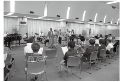
クリスマスコンサート