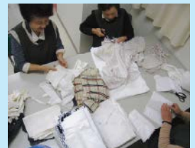
(ひまわりの会：ウエスのカット)