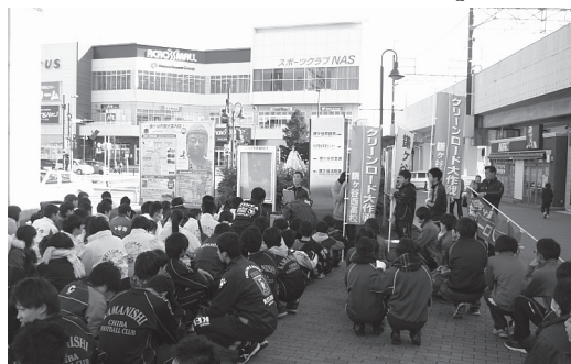
今年で5年目。全校生徒と地域住民によるクリーンロード大作戦 (県立鎌ケ谷西高校)