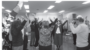
在宅福祉サービス事業