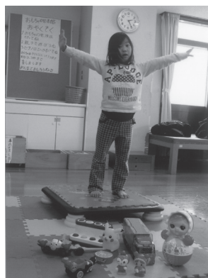
毎月おもちゃで交流。新しいおもちゃも購入できました (鎌ケ谷おもちゃの図書館「あ・そ・ぼ」)