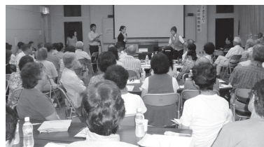
地区社協事業 講演会

社協会費は、昨年7月より自治会をはじめ、個人・団体・施設・商店・会社等多くのみなさまから社協事業についてご理解とご協力をいただき、誠にありがとうございました。ご協力いただきました会費は、法人運営・ボランティア育成・在宅福祉サービス・地域福祉推進・相談事業などに有効に活用させていただいております。