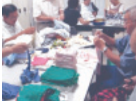
ウエスカットの活動風景（幸豊苑）

「ひまわりの会」は、「地域で暮らす仲間に来る人が出来ること事をしよう！」と市内の障がい者団体の外出介助や障がい児施設での同伴児の保育、高齢者施設でウエスカットのお手伝いなどの活動をしています。