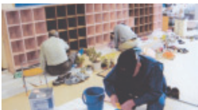
ペンキ塗りの活動風景（粟野保育園）

「やろう会」は「なんでもやろうーのやろう会！」市内の障がい児施設や保育園などでげた箱のペンキ塗り、介護施設で話し相手や囲碁・将棋などのふれあい活動をしています。