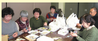
鎌ヶ谷市整理ボランティア「コスモスの会」