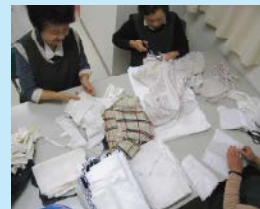
(ひまわりの会：ウエスのカット)