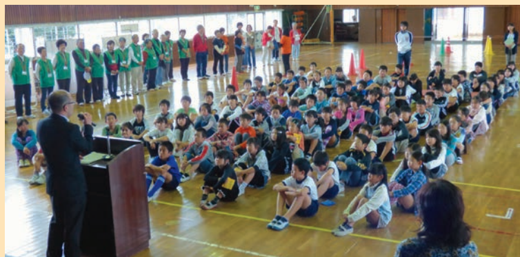
▲中部小学校 (参加児童数159名：午前・午後2回実施)