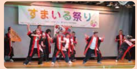
障がい者との交流に役立っています