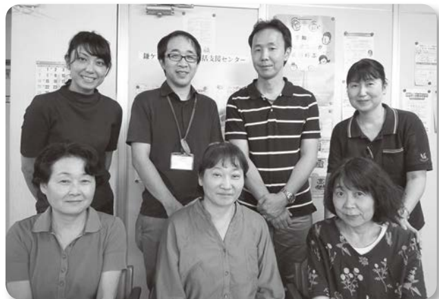
私達が対応します！