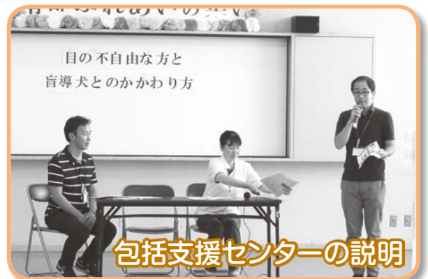
包括支援センターの説明