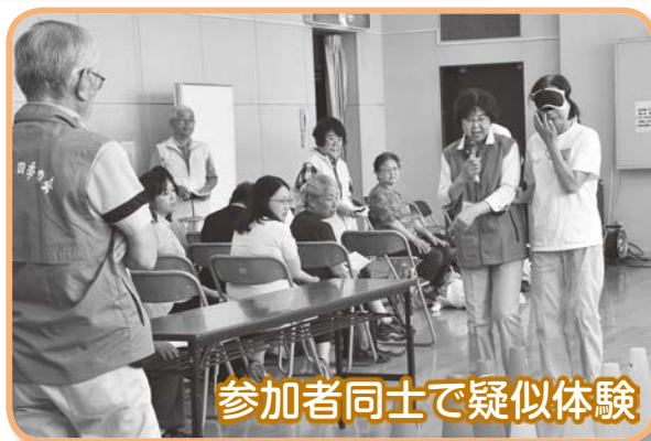
参加者同士で疑似体験