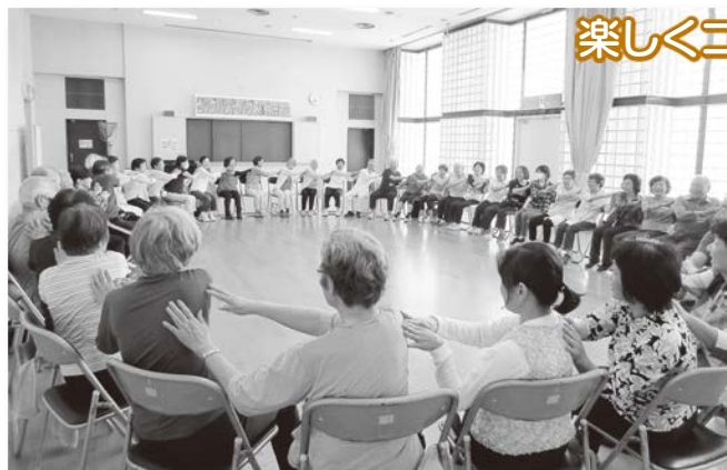
楽しくコグニサイズ

前回の回覧では1月の介護予防教室が笑いヨガの予定でしたが、先生のご都合でチェアヨガに変更となりました。