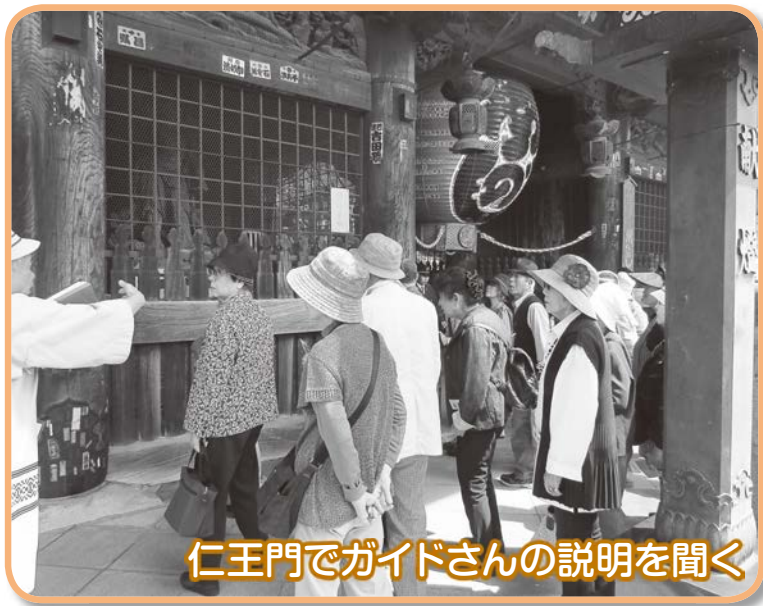
仁王門でガイドさんの説明を聞く