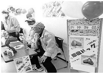
「原宿ドック」 ~みんなで笑顔に~ 在宅福祉委員会