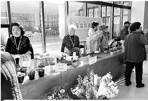
「切り花と花苗販売」～春の花 心豊かに～ ふれあい交流委員会