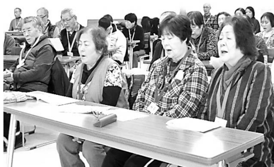
参加者全員で 8曲を合奏