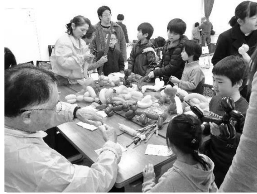
「あそびの広場」～子供たちと楽しく～ ボランティア育成委員会