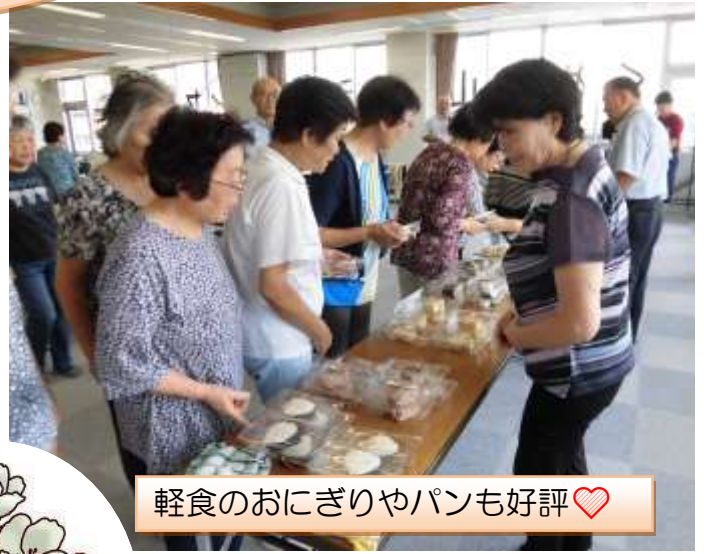
軽食のおにぎりやパンも好評♡