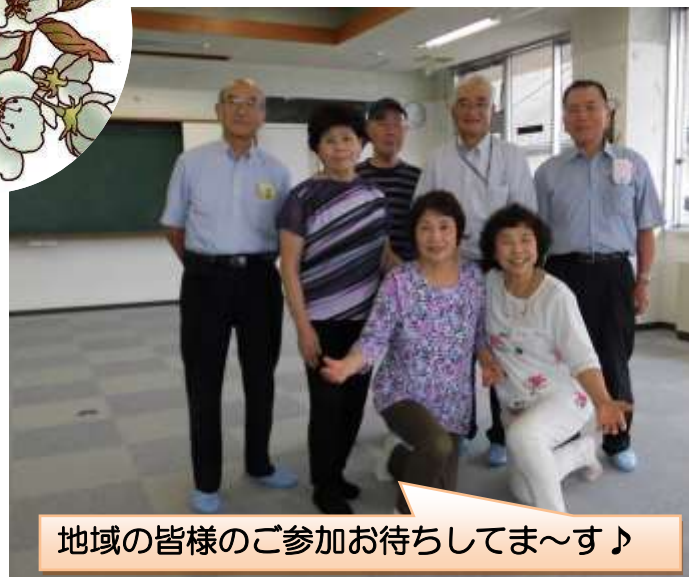
地域の皆様のご参加お待ちしております♪