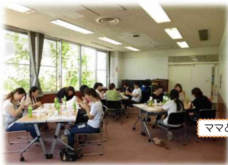
ママと子供達は別々のお部屋

西部地区社協では、今年度より子育て中のママを対象に支援事業を始めました。今回は、アロマオイルを使い、好きな香りで美容ジェルやオイルを作り、リラックスした時間を楽しんで頂きました。