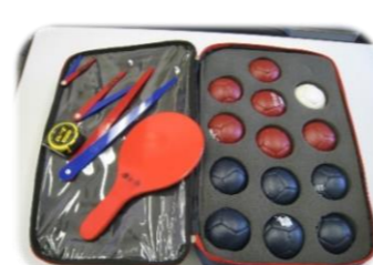
ボッチャゲームセット