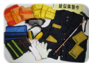
高齢者疑似体験セット