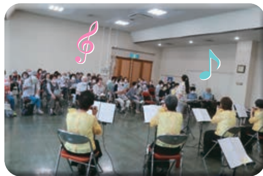
(鎌ヶ谷ハーモニカアンサンブル)