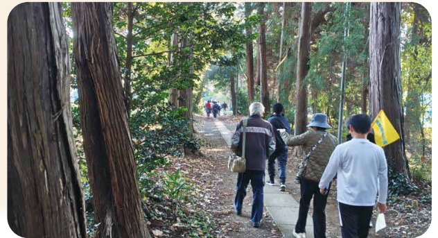
秋) 11月 「ウォーク&軽スポーツ」 新しい取り組みとして中沢自治会館で「クッブ」というゲームを楽しみました。