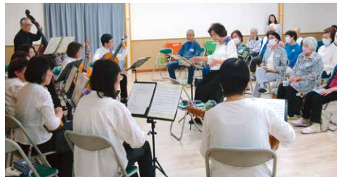
マンドリンの演奏会を楽しみました。