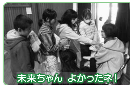
未来ちゃん よかったネ!