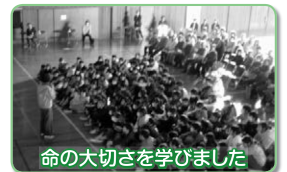
命の大切さを学びました