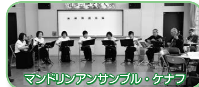
マンドリンアンサンブル・ケナフ