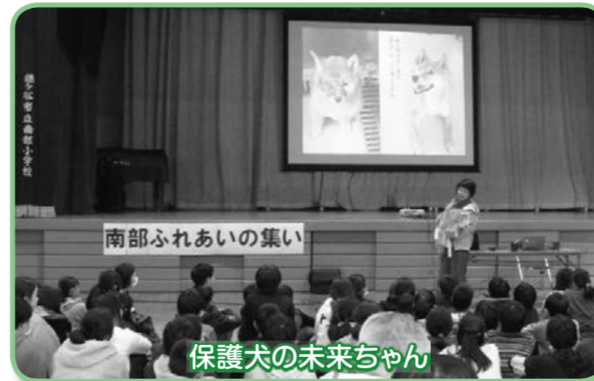
保護犬の未来ちゃん