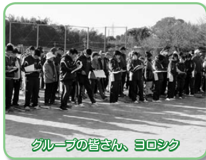
グループの皆さん、ヨロシク