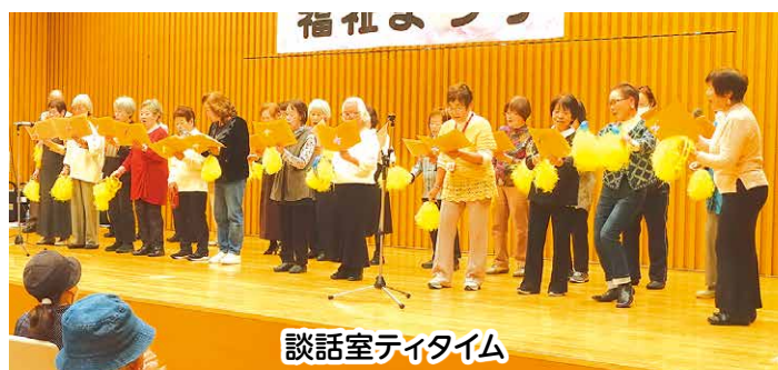
談話室ティタイム

展示の部では東部地区社会福祉協議会のふれあいサロン「すみれ」やみんなで健康「ほのぼの会」、「ひまわり」が作品等を出品しました。