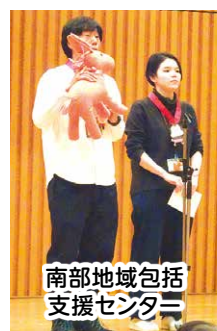
南部地域包括支援センター