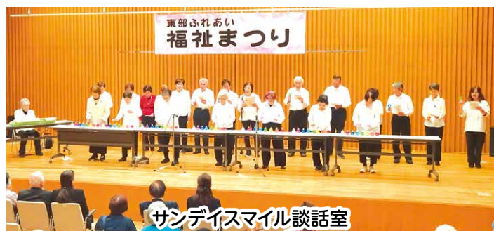
サンデスマイル談話室