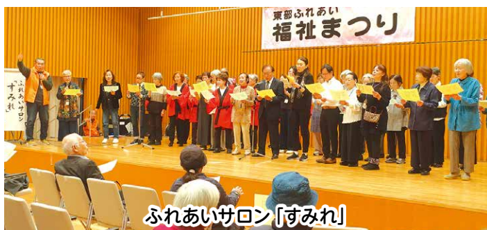
ふれあいサロン「すみれ」