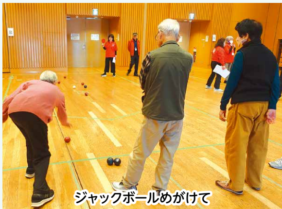
ジャックボールめがけて